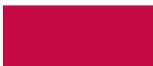
Cyan 0 Magenta 100 Jaune 56 Noir 19