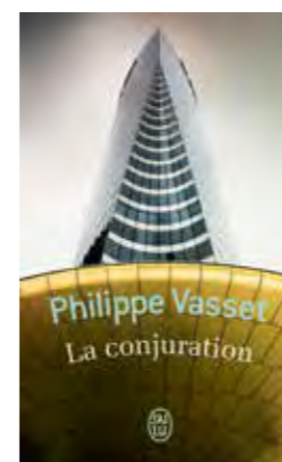
Philippe Vasset, La Conjuración , Fayard, 2013

Thomas B. Reverdy est l'auteur de cinq romans dont La Montée des eaux , L'Envers du monde (Seuil, 2003, 2008). Il a publié en 2013, Les Évaporés (Flammarion, Grand prix de la SGDL et prix Joseph Kessel).