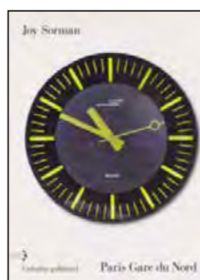
Joy Sorman, Paris Gare du Nord , Gallimard, 2011

Né en 1972, Philippe Vasset est diplômé en géographie, en philosophie et en relations internationales. Après avoir travaillé dans un cabinet d'investigation américain, il est aujourd'hui devenu rédacteur en chef d' Intelligence Online , publication spécialisée dans le renseignement industriel et politique, et de la rubrique « Africa Energy Intelligence » du magazine Africa Intelligence . Lauréat du prix du Jeune écrivain 1993, il est l'auteur de plusieurs romans et d'un récit d'investigation ( Un Livre blanc ).