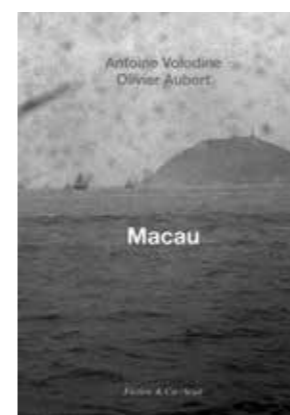
Antoine Volodine, Macau , Seuil, 2009

En 2005, elle écrit son premier roman, Boys, boys , paru chez Gallimard. Il rencontre un succès de librairie avec 10 000 exemplaires vendus. Elle reçoit le prix de Flore la même année.