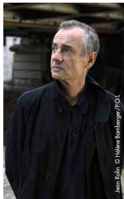
Jean Rolin

Né en 1949, à Boulogne-Billancourt, Jean ROLIN est un écrivain et journaliste français, auteur de reportages, entre autres pour Libération , Le Figaro , L'Événement du jeudi et GÉO . Écrivain, il est l'auteur de récits de voyage, de chroniques, de souvenirs, de romans et de nouvelles.