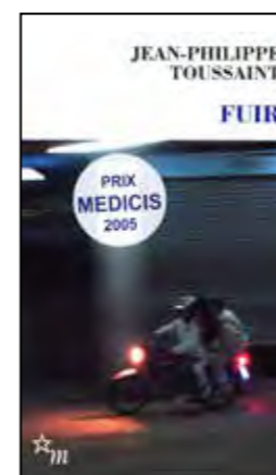
Jean-Philippe Toussaint, Fuir , Les Éditions de Minuit, 2005